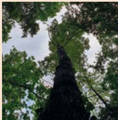
Roure de CD 25 alliberat de competència fa 5 anys, que no ha respost com s'esperava al tenir una capçada poc vital i massa comprimida verticalment.