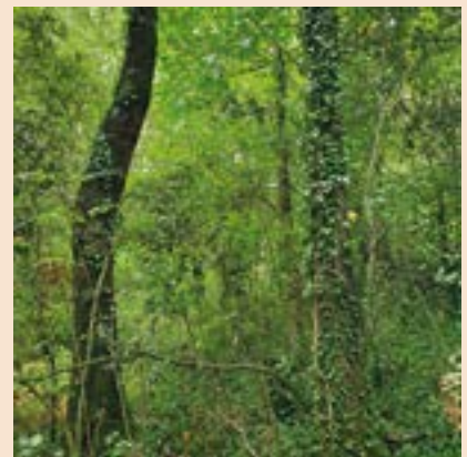
Arbre de curvatura excessiva (>3 cm/m), competidor d'un arbre classificat com d'alt valor.