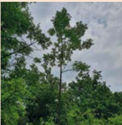
Els arbres de CD < 10 no es consideren arbres de valor fins que no estan ben diferenciats i la seva conformació és òptima.