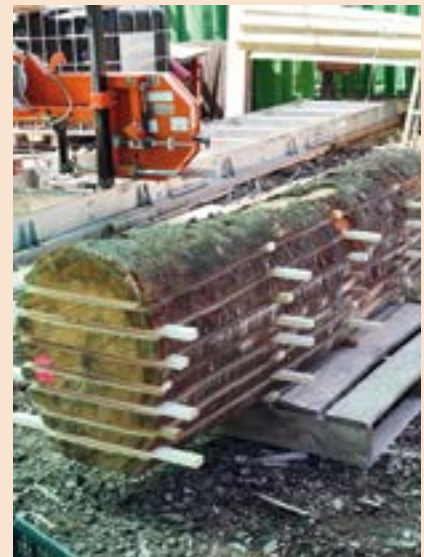
Cirerer tallat per a taulons en un pati de logística, al Maresme.

La SOA situa l'objectiu de gestió en l'arbre individual o en petits grups d'arbres, en contraposició a altres models silvícoles que consideren la forest sencera com a objectiu de gestió. Se l'ubica en el marc de l'anomenada «silvicultura naturalística» o «propera a la natura», i es caracteritza per aclarides selectives suaus i periòdiques (Beltrán, 2020). En la seva aplicació no es prioritza el compliment estricte d'uns paràmetres a escala de rodal (AB, arbres/ha, etc.) com passa en altres models, sinó que el criteri de tallada prioritza el potencial de cada individu concret i els processos naturals que afavoreixen l'objectiu i vocació de cada rodal. Les aclarides se centren en l'eliminació d'arbres amb escàs potencial de millora i que exerceixen competència sobre arbres de més potencial, ja siguin grans, petits o fins i tot claps de regeneració.